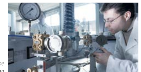
Labor für kundenspezifische Prüfungen