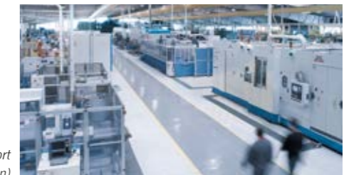
Fertigungsstandort Polpenazze d/G (Brescia - Italien)

anzubieten. Wir erarbeiten Systeme unter Verwendung hochwertiger Komponenten. Das Qualitätsmanagement von Camozzi Automation ist verantwortlich für die Einhaltung der Richtlinien nach ISO 9001 und ISO 14001: Qualität in allen Bereichen der Produkte und Prozesse im Einklang mit der Umwelt. Exzellenz bei allen Aktivitäten durch kontinuierliche Verbesserung.