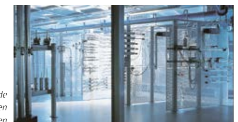
Prüfstände für die unterschiedlichsten Betriebsbedingungen